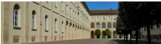
Sede staccata (Seminario Piazza Bussi, 2)

Il percorso del Liceo Classico è indirizzato allo studio della civiltà classica e della cultura umanistica. Favorisce una formazione letteraria, storica e filosofica idonea a comprenderne il ruolo nello sviluppo della civiltà e della tradizione occidentali e nel mondo contemporaneo sotto un profilo simbolico, antropologico e di confronto di valori.